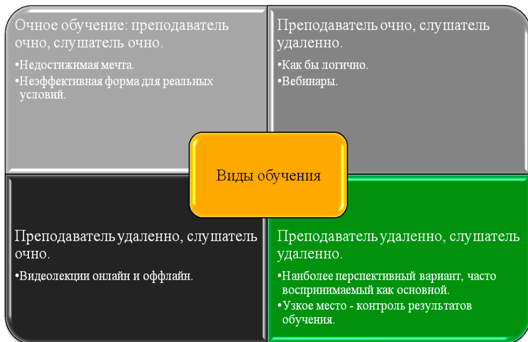
Рисунок 1: классификация технологий обучения в зависимости от места нахождения преподавателей и обучаемых.

Критериев классификации видов дистанционного обучения два: где по отношению к нам находится преподаватель, а где – студент: