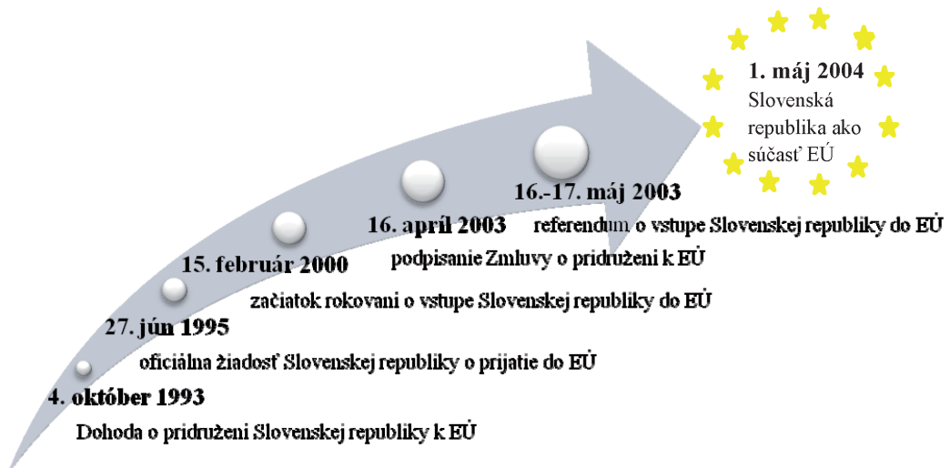
Obrázok 2: Míľniky Slovenskej republiky na ceste k členstvu v Európskej únii

Slovenská republika, už ako samostatná krajina, zo svojej vízie členského štátu Európskej únie neupustila. Náročný proces začlenenia Slovenskej republiky do Európskej únie (ďalej, EÚ) a jeho najdôležitejšie medzníky zachytáva nasledujúci obrázok (obrázok 2).